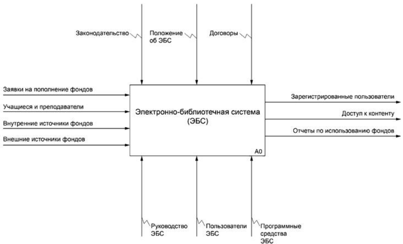
Рисунок А.1 - Контекстная диаграмма